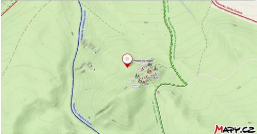
Skutečná poloha obrázku č. 1/1